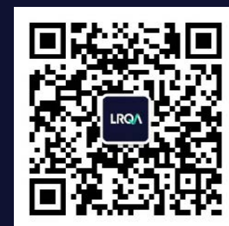
扫码关注官方微信