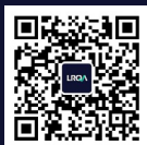
扫码关注官方微信